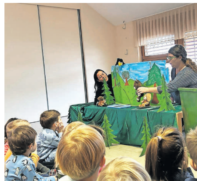
Lutkovna predstava Zrcalce / FOTO: ARHIV VRTCA

vstopili v svet lutk in s tem doživeli čarobnost gledališča. Predstava Zrcalce ni bila le zabavna, temveč je otrokom omogočila, da se skozi igro in zgodbo naučijo pomembnih življenjskih lekcij. Projekt spodbujanja aktivnega učenja skozi kulturno-likovno ustvarjalnost je v vrtcu zasnovan tako, da otrokom omogoči bogate izkušnje, ki segajo daleč čez