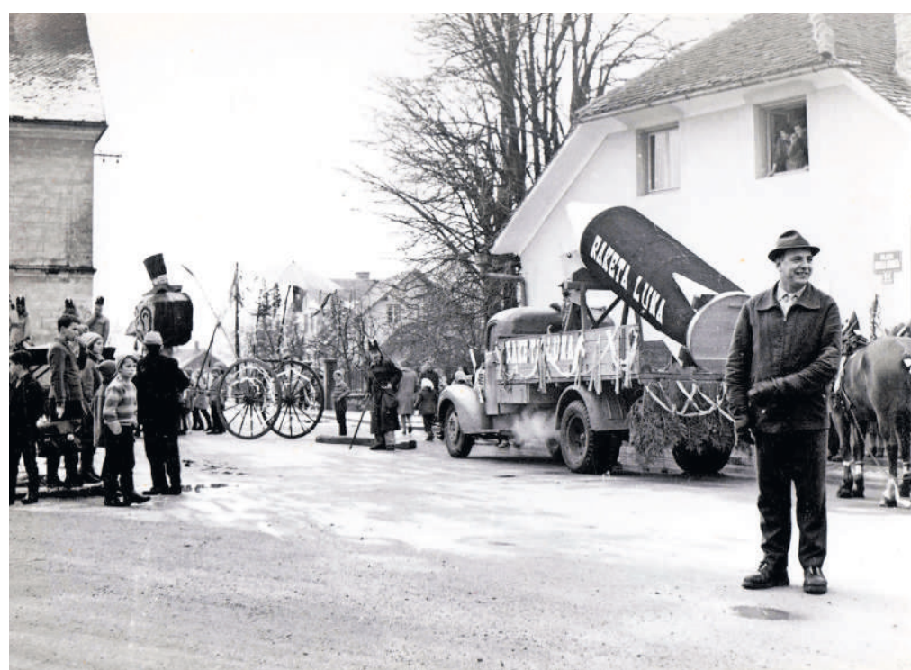
Pustni sprevod z raketo pred Korobačem, 1962.

V tovarni so priprave na sprevod potekale cel mesec – predvsem ob koncih tedna in izven delovnega časa. Največ dela so imele njihove podporne službe – mizarji in orodjarji so izdelovali rekvizite ob vednosti predpostavljenih. Sprevod se je začel takoj po koncu dopoldanske izmene z objokovanjem »žalostnega dogodka« v sami tovarni, nakar je sprevod krenil po Grabnu in po Šutni in se končal na Glavnem trgu. Sam obred pokopa pa je bil zasnovan na smešenju – parodiranju cerkvenega pogreba. Na veliko zadovoljstvo