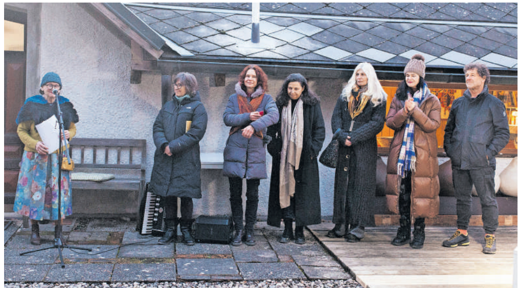
Na razstavi Besede je sodelovalo sedem keramikov.