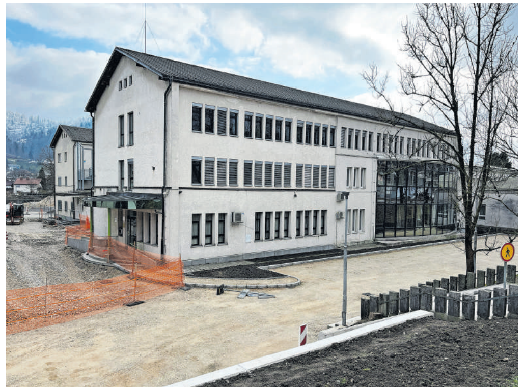
Na območju knjižnice in glasbene šole poteka tudi urejanje zunanjih parkirnih površin.

»Vseh energetskih sanacij se lotevamo s ciljem, da bo poraba čim manjša. Pri prenovi knjižnice in glasbene šole pa se nadejamo tudi sofinanciranja države v okviru razpisov, ki se že najavljajo. Medtem pa smo nekaj sredstev že prejeli za pripravo dokumentacije,« pravi župan, ki dodaja, da sredstva države lahko pričakujejo za energetske sa-