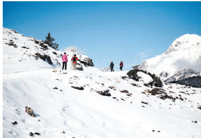
Na Veliki planini je ob zadnjem sneženju zapadlo med 15 in 20 centimetrov snega.

sko skupino 5 evrov na učenca, končna cena s subvencijo pa je 3 evre na učenca. Od 15. februarja dalje na Veliki planini obratujeta otroška vlečnica Jurček in otroški smučarski trak, in sicer vsak dan med 8.30 in 15.30. Prav tako je odprta sankška proga, kjer je sankanje možno od 8.30 do 16.15. Sankška proga poteka od vmesne postaje sedežnice do zgornje postaje nihalk. Izposoja sani je možna tudi na zgornji postaji nihalk. »Nočno sankanje se za zdaj zaradi nezadostne količine snega še ne izvaja. Prav tako je premalo snega za odprtje preostalega dela smučišča,« so dodali v družbi Velika planina.