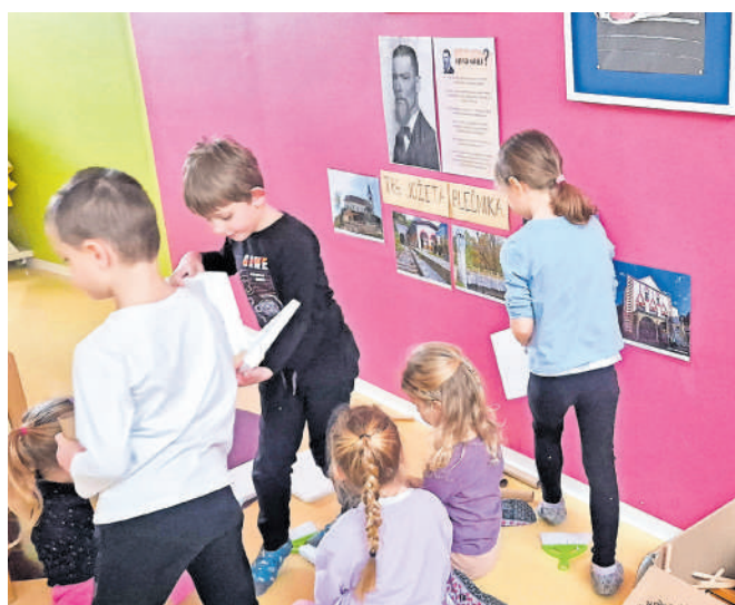
Fotografije arhitekturnih del Jožeta Plečnika otroke popeljejo v čudovite koticke mesta Kamnik.

Osrednja prostora vrtca otroke v teh dneh vabita k raziskovanju in učenju kulturnih vsebin, kjer se otroci seznanjajo s kiparstvom in spoznavajo delo kamniškega kiparja Mihe Kača. Eno izmed njegovih del, kip mamuta, otroci vsakodnevno srečujejo pri igri v senzori-