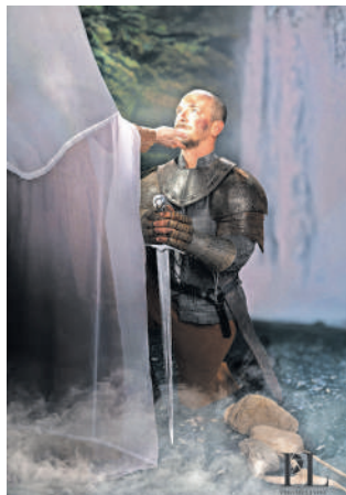
Srečanje Črtomira in Bogomile v Bohinju (Krst pri Savici)

Motnik – Več dejavnikov je sovpadlo, da sta se fotografa Mih Lindič in Eva Jeseničnik iz fotografskega studia Foto Lindič odločila za ta projekt. »Ljubezen do Prešernove poezije, ponos na slovensko zgodovino, tema, ki sovпада z najino fotografsko ustvarjalnostjo, okrogla obletnica ustanovitelja studia, ki praznuje ravno na Prešernov dan, ter promocija.« Mih si ga je zamislil kot tematsko fotografiranje. »Izbrala sva Zdravljico, Sonetni venec, Krst pri Savici in Povodnega