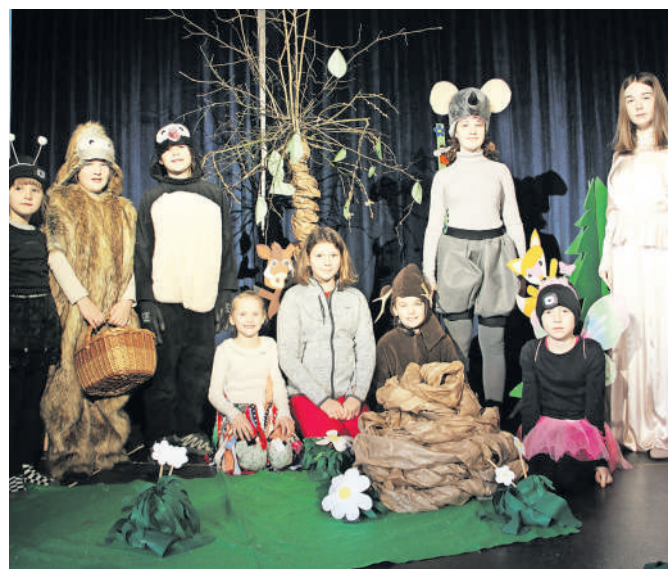
Skupinska z Julijo

vala tudi Julija, Prešernova muza. Veliko radovednih in vedoželjnih glav si je izmenjalo knjige. Vsem nam, ki jim je knjiga svetinja, pa je igralo srce. Po prireditvi smo se posladkali s slastnimi palačinkami in sklenili, da pripravimo prireditev tudi prihodnje leto. Zvečer pa smo se nasmejali ob ogledu komedije Kje je Shakespeare v izvedbi Koroškega deželnega teatra. Ob odhodu si je vsak obiskovalec lahko izbral knjigo. Da je vse teklo kot po maslu, je skrbel ekipa ŠKD Mekinje. Ponosni smo na Mekinjčane, ki so se tako množično udeležili prireditve, sodelovali in dokazali, da je kultura doma tudi v Mekinjah. Bilo je prešerno in navdihujoče.