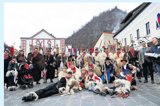
Kamnik bodo obiskali koranti iz Zamušanov pri Ptujju.

Kamnik bodo v soboto, 22. februarja 2025, ob 10. uri obiskali koranti iz Zamušanov pri Ptujju, spremljale pa jih bodo tudi druge etnografske maske s Ptujjskega polja. Na Glavnem trgu bodo s svojim mogočnim plesom preganjali zimo in zlo ter priklicali pomlad, srečo in dobro letino.