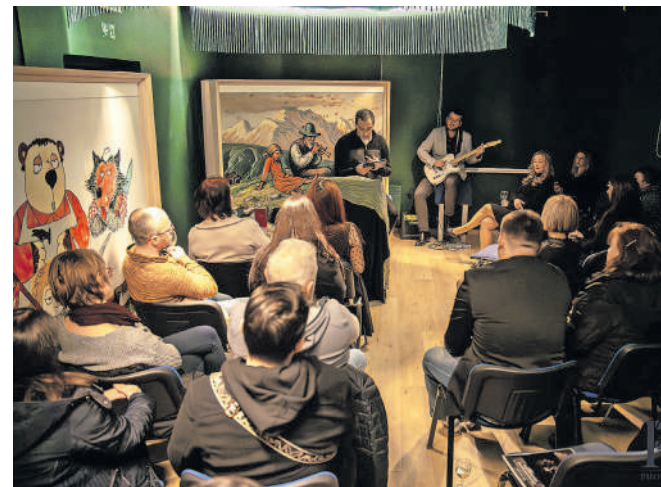
Večer zamolčane Prešernove poezije

ustvarjanja – od hudo mušnih do globoko razmišljujočih. Članom društva je s svojimi interpretacijami uspelo približati pesnika v vsej njegovi širini – kot človeka, ki se je skozi besede boril s stiskami časa, se poigral z ironijo in hkrati ohranjal nezmeren pesniški talent. Dogodek je s svojim izjemnim ambientom in odlično izvedbo pustil močan pečat. Obiskovalci so večer doživeli kot pravo literarno popotovanje v preteklost, ki pa je z aktualnostjo Prešernovih sporočil seglo tudi v današnji čas. Tako je kulturni praznik v Motniku znova dokazal, da kultura v kraju ne le živi, temveč se razvija in bogati skupnost.