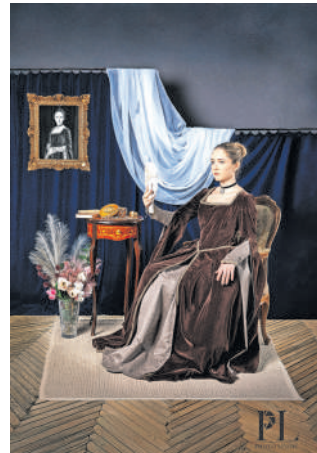
Portret prevzetne Urške (Povodni mož)

dila pri turističnem in kulturnem društvu (KD) Motnik ter pri KD Elizabeta iz Slovenj Gradca, kjer sta dobila bojno opremo ter večino stilnega pohištva in rekvizitov. Nekaj sta izdelala sama. Že v scenariju sta zasnovala deset fotografij: eno za Zdravljico in po tri za vsako pesem. Posnela sta jih v studiu, saj sta jih želela prikazati kot