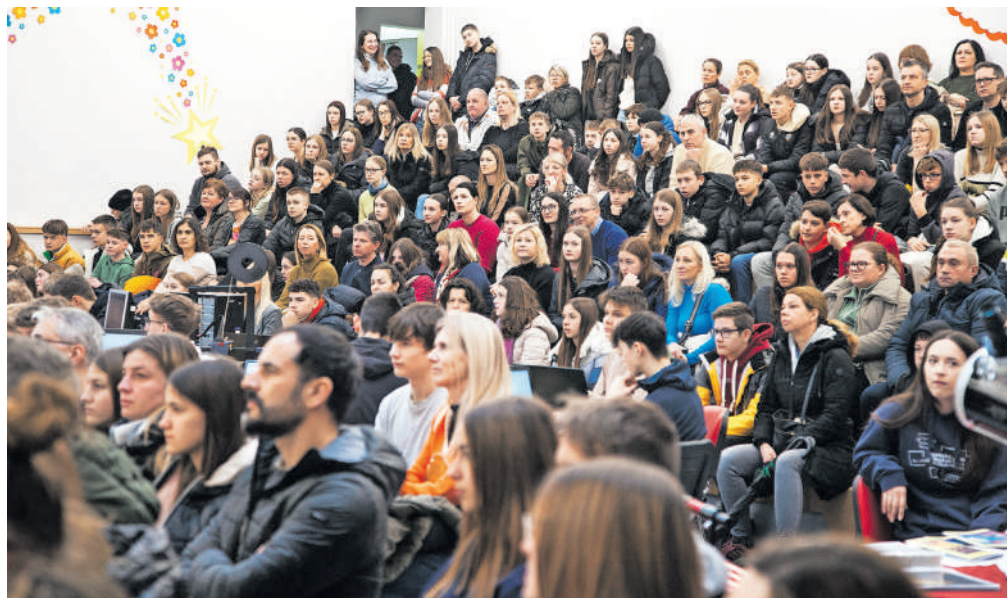
Informativne dneve je obiskalo precejšnje število bodočih dijakov in njihovih staršev.

Tudi v prihodnjem letu bodo sprejeli štiri oddelke gimnazijcev ter po dva oddelka na programih predšolska vzgoja in ekonomski tehnik. Skupaj je tako na voljo 112 mest na gimnaziji in po 56 mest na obeh strokovnih programih. Kakšen bo vpis, je še prezgodaj ugotavljati, saj imajo devetošolci čas za razmislek še