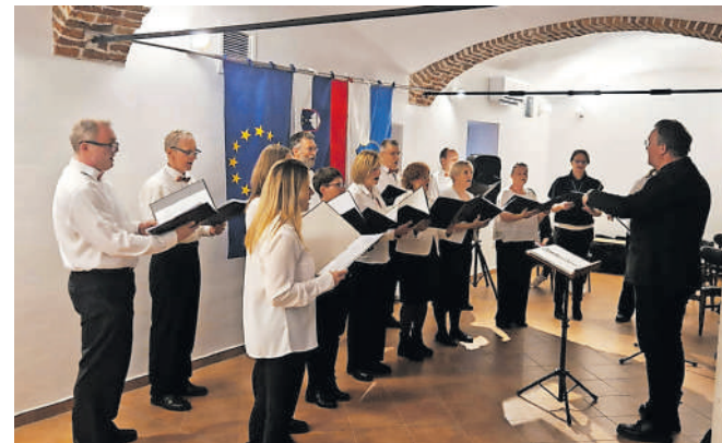
Komorni pevski zbor Šutna