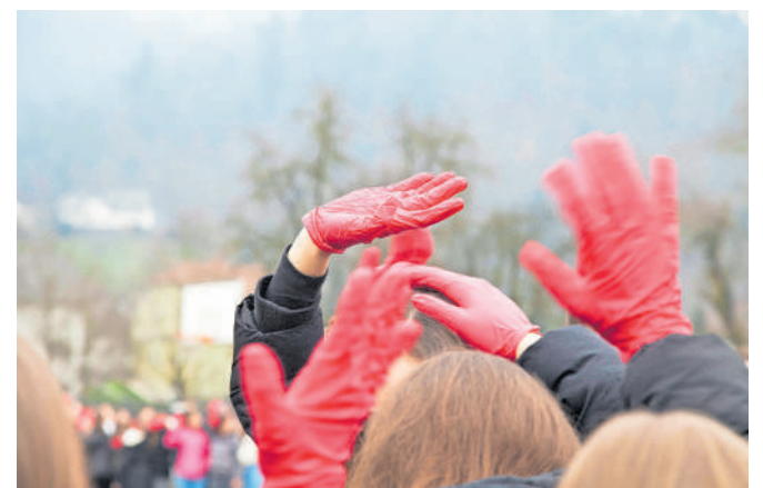
Dijaki so si nadedli simbolne rdeče rokavice in z njimi "obarvali" srce, ki so ga formirali.

za dobre stvari,« nam je na vprašanje, ali se mnenje mladih dovolj upošteva v današnji družbi, povedala so-