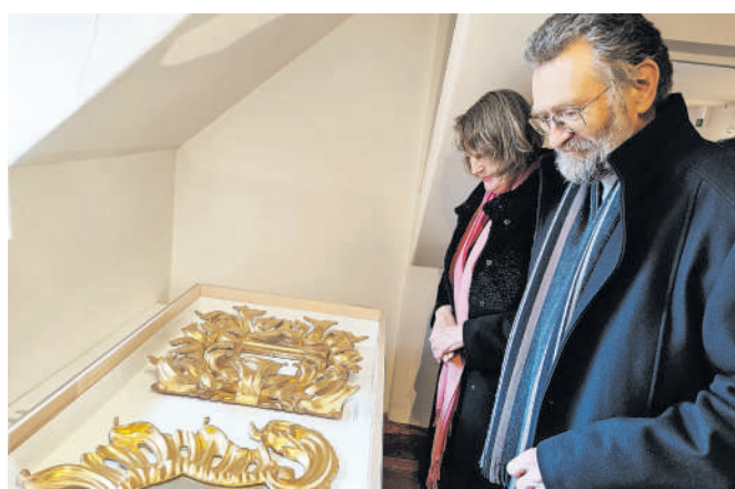
Razstavljeni dela Maksa Berganta so bila deležna velikega občudovanja.