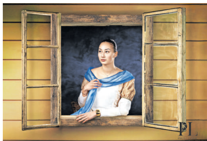
Upodobitev Julije Primic s spomenika na Wolfovi ulici v Ljubljani (Sonetni venec)