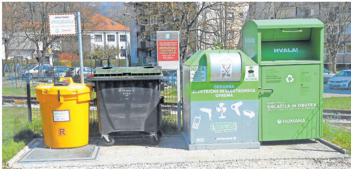
Super ekološki otok na Tunjski cesti