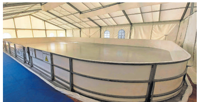
Drsanje in kratkočasenje v Snoviku vse do marca

V Tuhinjski dolini, eni redkih neokrnjenih slovenskih dolin, tudi tako izpolnjujemo svoje