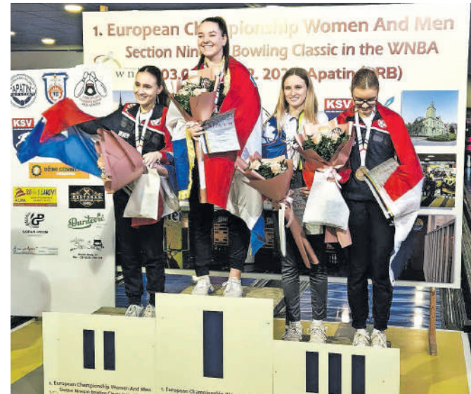
Prvenstvo je bilo za slovensko vrsto zelo uspešno, saj je osvojila kar devet medalj, od tega dve zlati, tri srebrne in štiri bronaste.

V celoti gledano je bilo to prvenstvo za slovensko vrsto zelo uspešno, saj je osvojila kar devet medalj, od tega dve zlati, tri srebrne in štiri bronaste.