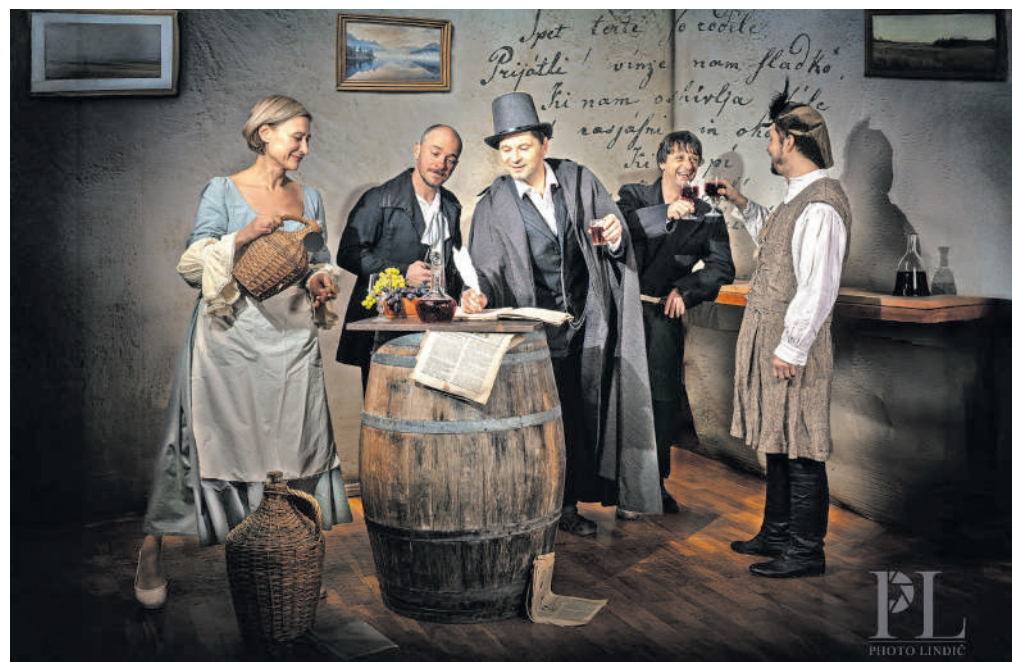
France Prešeren med pisanjem Zdravljice v gostilni, obkrožen s prijatelji