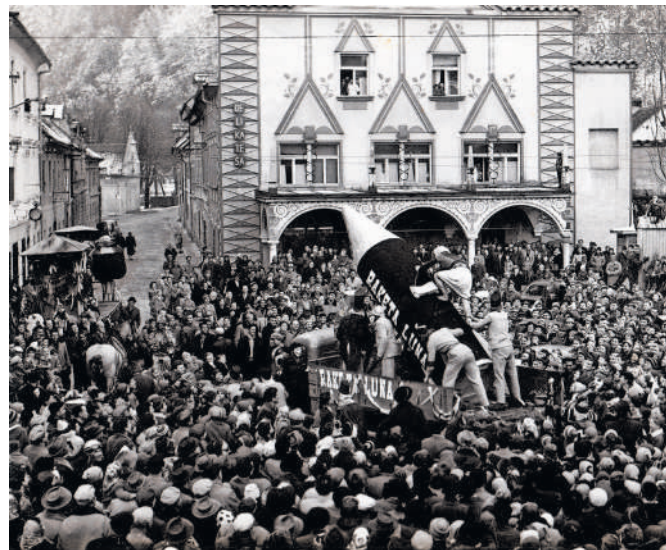
Prireditev na Titovem trgu pred Delikateso, 1962