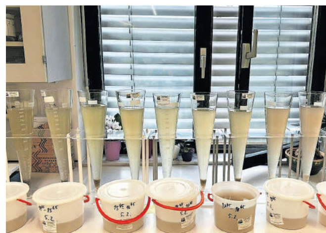
Na rezultate analiz v čistilni napravi še čakajo.

»Zaradi teh izrednih razmer, ki so v CCN Domžale - Kamnik povsem onemogočile izvajanje ustaljenih procesov čiščenja komunalne odpadne vode, ki priteka v čistilno napravo iz občin Domžale, Kamnik, Komen, Mengeš, Trzin in Cerklje na Gorenjskem, posledično prihaja do čezmernega one-