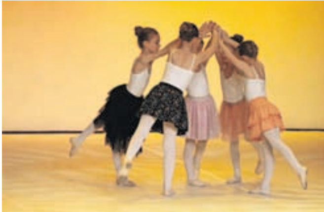
Glasbena šola Kamnik (Plesna pripravnica) s točko Podaj mi gib

Na reviji so nastopile skupine, ki gojijo različne zvrsti plesa, od baleta do hiphopa, od klasike in stilskih žanrov do sodobnih oblik izraznosti z gibom. Tako so se predstavili: kamniški Baletna šola Ana, Plesni klub Šinšin, KUOD Bayani in Glasbena šola Kamnik, Plesni studio Impulz in KUD Tarab iz Domžal ter plesalci OŠ Iva-