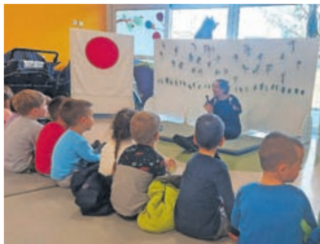
Mednarodni dan knjig za otroke v vrtcu Zarja