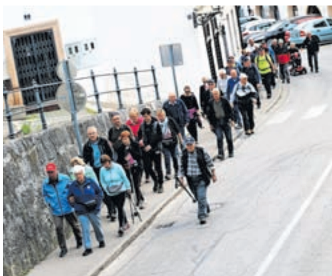
Maistrovega pohoda se je udeležilo okoli petdeset pohodnikov.