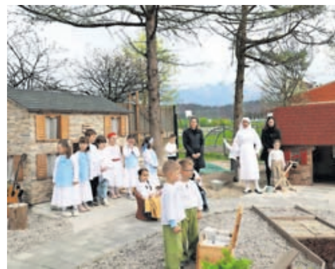
Otroci bodo skozi zgodbe slovenske vasice spoznavali korenine kulturne dediščine slovenskih pokrajin.

Občina Kamnik je za novo pridobitev namenila slabih 21 tisoč evrov, 250 evrov je bilo donacije, dobrih 8.500