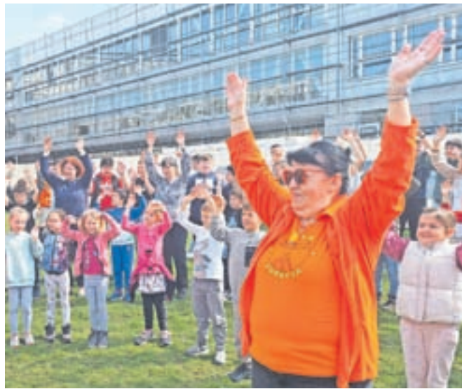
Dan zdravja na Osnovni šoli Frana Albrehta

nekatero že odhitele na šolski vrt matične šole, kjer so se skupnega gibanja veselili učenci 1., 2., 3., 7. in 8. razreda, nekateri zaposleni in članice društva Perovček. Združeni v krogu različnih generacij, obsijani s soncem in z dobro voljo v srcih smo sledili gimnastičnim vajam od glave do pete, ki jih je vodila Martina. Hitro nam je bilo jasno, da vaja dela mojstra, če mojster dela vajo, da smo lahko zdravi in poskočni, če poskrbimo tudi za gibanje. Med izvajanjem vaj smo bili zelo pozorni tudi na dihanje. Druženje smo zaključili s pozdravom soncu. Člani Društva Šola zdravja so nam za konec zapeli svojo himno. V naših srcih se je prebudila hvaležnost, da so z nami delili gibalne minute in veselje