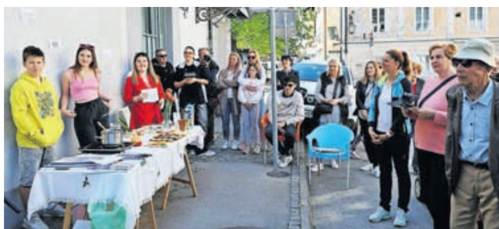
Dan odprtih vrat svetovalne pisarne za starejše