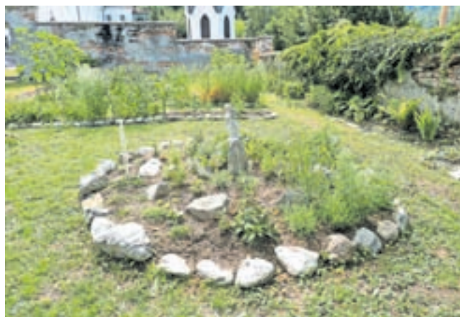
Javni zavod za kulturo Kamnik se je v projekt Commheritour vključil z zeliščarsko in kulinarčno dediščino.

Kamnik – Naravna in kulturna dediščina igrata ključno vlogo pri spodbujanju gospodarske rasti, ustvarjanju delovnih mest, oživljanju skupnosti ter kreptvi povezanosti med različnimi skupnostmi v Podonavju. Na tovrstne potenciale kulturne dediščine se osredotoča projekt Commheritour, ki ga financirata Evropska unija iz programa Interreg Podonavje in Občina Kamnik. Nosilka projekta je madžarska občina Jászberény, projekt pa povezuje 12 partnerjev iz 8 držav podonavske regije. Slovenijo v partnerstvu poleg Univerze v Ljubljani zastopa tudi Javni zavod za kulturo Kamnik. Skupna vrednost projekta, ki bo potekal 30 mesecev, presega 2,1 milijona evrov. V jedru projektnih aktivnosti je podpora tradicionalnih rokodelskih obrti in dejavnosti, utemeljenih na nesnovni kulturni dediščini – Commheritour oboje razume kot ključni sredstva za