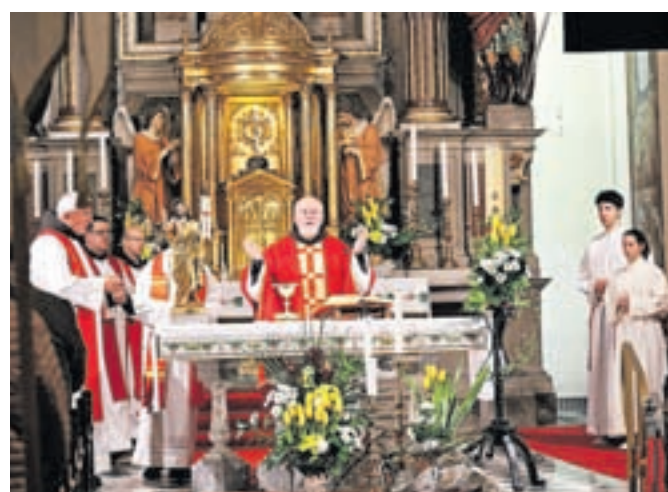
Spominska maša za pokojne profesorje in dijake Gimnazije in srednje šole Rudolfa Maistra

telji niti intelektualci, ki so bili zadnji braniki svobode. Danes smo preko optimalne točke svobode. Danes je svoboda mogoče ohraniti le tako, da se ji deloma odrečemo. Zahodna družba ta trenutek potrebuje konsenz o zmanjšanju svobode in nujni povrnitvi avtoritet, sicer bo prišlo do zdrsa v kaos in nastopa nove diktature. Bolje se je odreči delu svobode, kot pa zdrkniti v diktaturo in