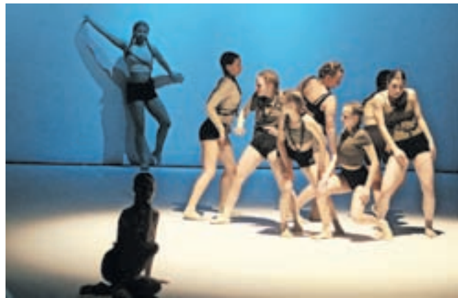
Plesni klub Šinšin se je gledalcem na letošnji območni reviji predstavil s petimi nastopi, tudi s točko Korenine (SDM1 – show dance mladinci, tekmovalna skupina).