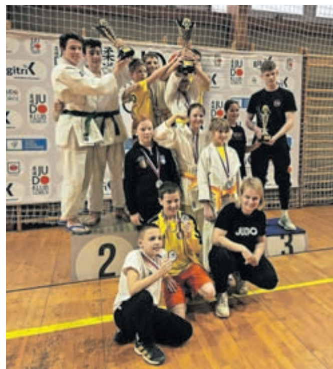
Judoisti kamniškega kluba so se s Pokala Gorice vrnili s petnajstimi medaljami.

Tudi starejši dečki in deklice U14 ter mlajši dečki in deklice U12 niso razočarali. Dru-